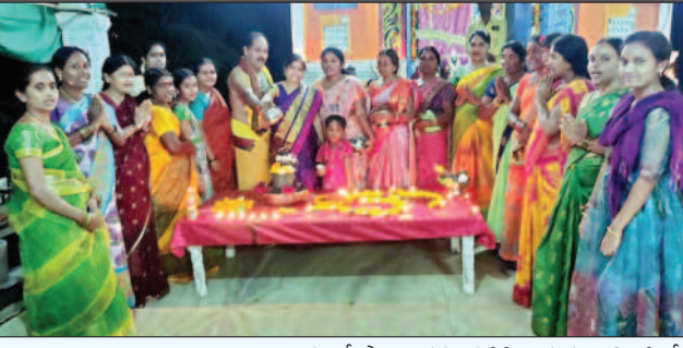
కాల్వడంతో పాటు గర్భ గుడికి ఎదురుగా పిండితో చేసిన దీప ప్రమిదలతో దీపాలు వెలిగించారు. మొత్తంగా ఘనంగా కార్తీక పౌర్ణమి వేకువజాము దీపోత్సవం జరిగింది.

నిర్వహించి ఉదయం 9గంటల లోపే దేవాలయాన్ని గ్రహణ కాలం ఆనంతరం మూసి వేస్తామని తదనంతరం ప్రక్షాలన చేసి మల్లి పూజలు నిర్వహిస్తామని వారు పేర్కొన్నారు. ఈ వేకువ జాము దీపోత్సవంలో స్థానిక మహిళలు, ఇతర గ్రామాల మహిళలు తదితరులు పాల్గొని 365 వత్సలను దేవాలయ ప్రాంగణంలో ఉన్న ఉసిరి చెట్టు ముందు