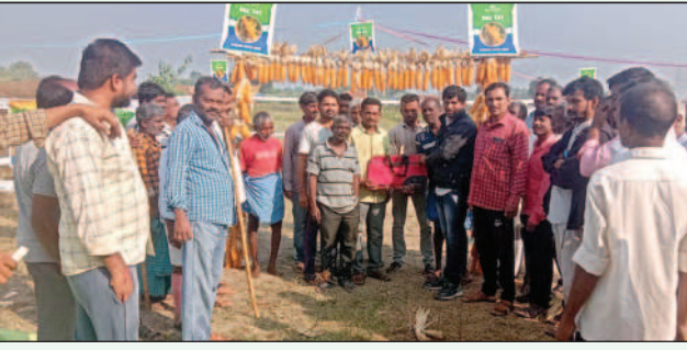
దిగుబడులు సాధించాలని ఆయన సూచించారు. ఈ కార్యక్రమంలో 128 రైతులు పాల్గొన్నారు.

వారు రైతును అభినందించారు. ఈ సందర్భంగా చింతం వినయ్ మాట్లాడుతూ రైతులు, గుర్తింపు లేని కంపెనీల విత్తనాల వాడి మోసపోవద్దని యుపీఎల్ కంపెనీ అన్ని రకాల నాణ్యత వృత్త విత్తనాలు రైతులకు అందిస్తున్నది. (పీపీసీ 741 అధ్యక్షుల) రకము మొక్కజొన్న విత్తనాలు వేసి రైతులు అధిక